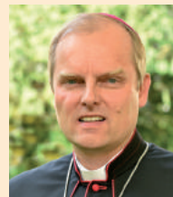
Florian Wörner Weihbischof und Bischofsvikar für die Förderung der Neuevangelisierung in der Diözese Augsburg.

Falls Sie eine Übernachtungsmöglichkeit brauchen, bitten wir Sie, sich eigenständig darum zu kümmern.